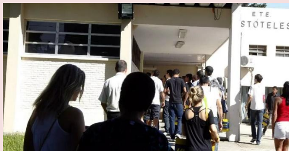
Etec Aristóteles Ferreira (Carlos)

O Relatório Socioeconômico do processo seletivo das Escolas Técnicas Estaduais (Etecs) mostra que os etecanos “rejuvenesceram” nos últimos dez anos. No Vestibulinho para o primeiro semestre deste ano, 80% dos aprovados têm até 23 anos – eram 75% em 2011. A maioria dos convocados continua vindo da rede pública de ensino (78%), tem renda familiar de até 5 salários mínimos (90,13%) e espera melhorar suas qualificações profissionais (61,25%).